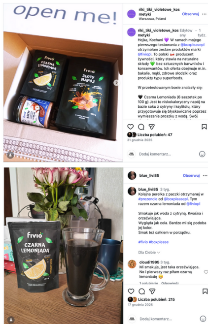
FOTO: po lewej - kampania z Elfi Santa po prawiej fivio