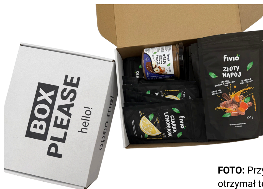
FOTO: Przykład - paczka, którą otrzymał tester w ramach kampanii z marką fvivo.